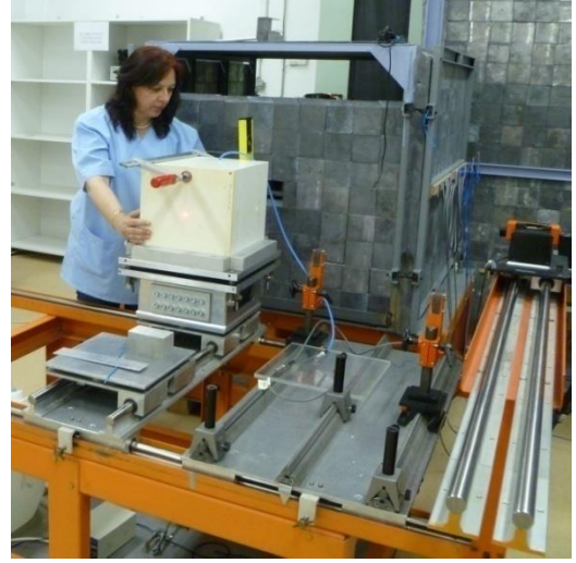
Şekil-3 Katı fantom düzenegi

Simulasyon çalışmalarında EGSnrc kodlu Monte Carlo doz simülasyon programı kullanılmış olup, standart ışınlama düzenegi software ortamında hem su fantomu hem de RW3 katı fantomu için oluşturularak, bu verilere göre transfer faktör belirlemiştir. Bu yazılım programına ait ara yüz Şekil-4 te gösterilmektedir.