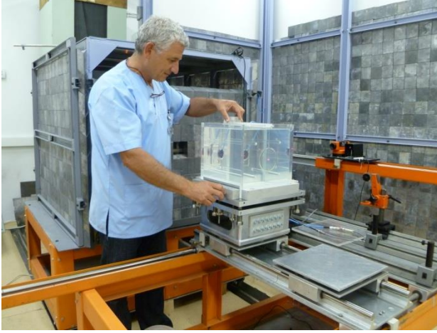
Şekil-2 Su fantomu düzenegi

Ölçümler, ön ışınlama işlemleri bittikten sonra, 1'er dakikalık 10 tekrarlı okuma ile kayıt altına alınıp bu değerlerin aritmetik ortalaması alınarak ham doz değeri ortaya çıkmıştır. Doz ölçüm işleminin başlangıcında ve sonunda kaydedilen basınç ve sıcaklık değerlerine uygun atmosferik düzeltme faktörü belirlenmiştir. Ham doz değeri basınç ve sıcaklık düzeltme faktörleriyle normalize edilerek son halini almıştır. Bununla birlikte, deneysel çalışmalar sırasında, her bir ölçüm sonucunun mümkün olan en düşük hata değeri ile belirlenebilmesi için fantom değişimleri hiç zaman kaybedilmeden birbirinin peşi sıra yapılarak kaynağın bozunma faktöründen gelebilecek hata minimum seviyede tutulmuştur. Şekil 2 ve Şekil 3'de her bir ölçüm için hazırlanmış su fantomu ve katı fantom düzenekleri ayrı ayrı gösterilmektedir.